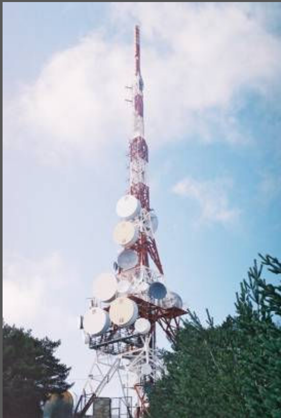
Services to local radio stations